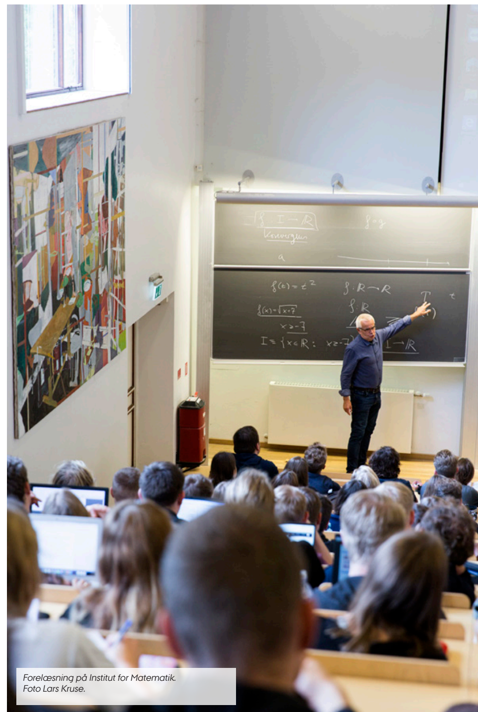
Forelæsning på Institut for Matematik.

Undervisningen skal understøtte læring gennem varierede og aktiverende læreprocesser, som gør det muligt for studerende at tilegne sig fagets viden, færdigheder og kompetencer. De valgte eksamensformer skal sikre, at det lærte afprøves, og at den studerendes præstationer bliver retfærdigt vurderet.