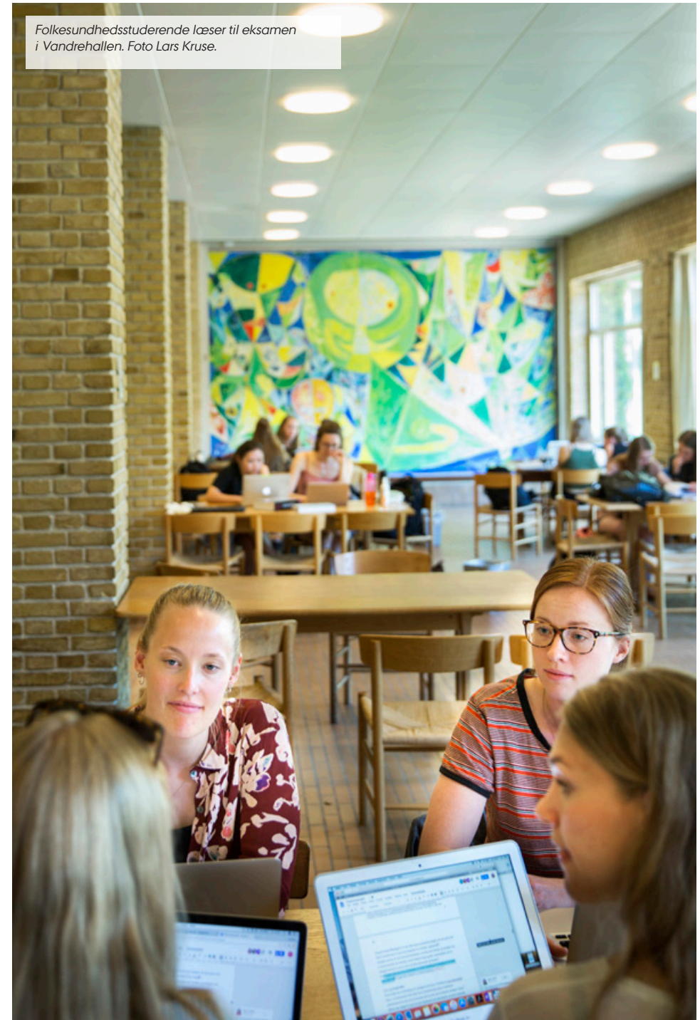
Folkesundhedsstuderende læser til eksamen i Vandrehallen.

AU er et campusuniversitet, hvis fysiske rammer skal bidrage til et stimulerende studie- og læringsmiljø. Alle studerende skal have et bredt udvalg af muligheder for at deltage i faglige og sociale fællesskaber, hvor der er fokus på engagement, rummelighed og seriøsitet. Sammen med de faglige miljøer og uddannelsesledelsen skal studerende bidrage til at skabe et inkluderende studiemiljø, hvor respekt og ordentlighed støtter alle i at sige fra over for chikane, mobning, voldelig adfærd og diskrimination.