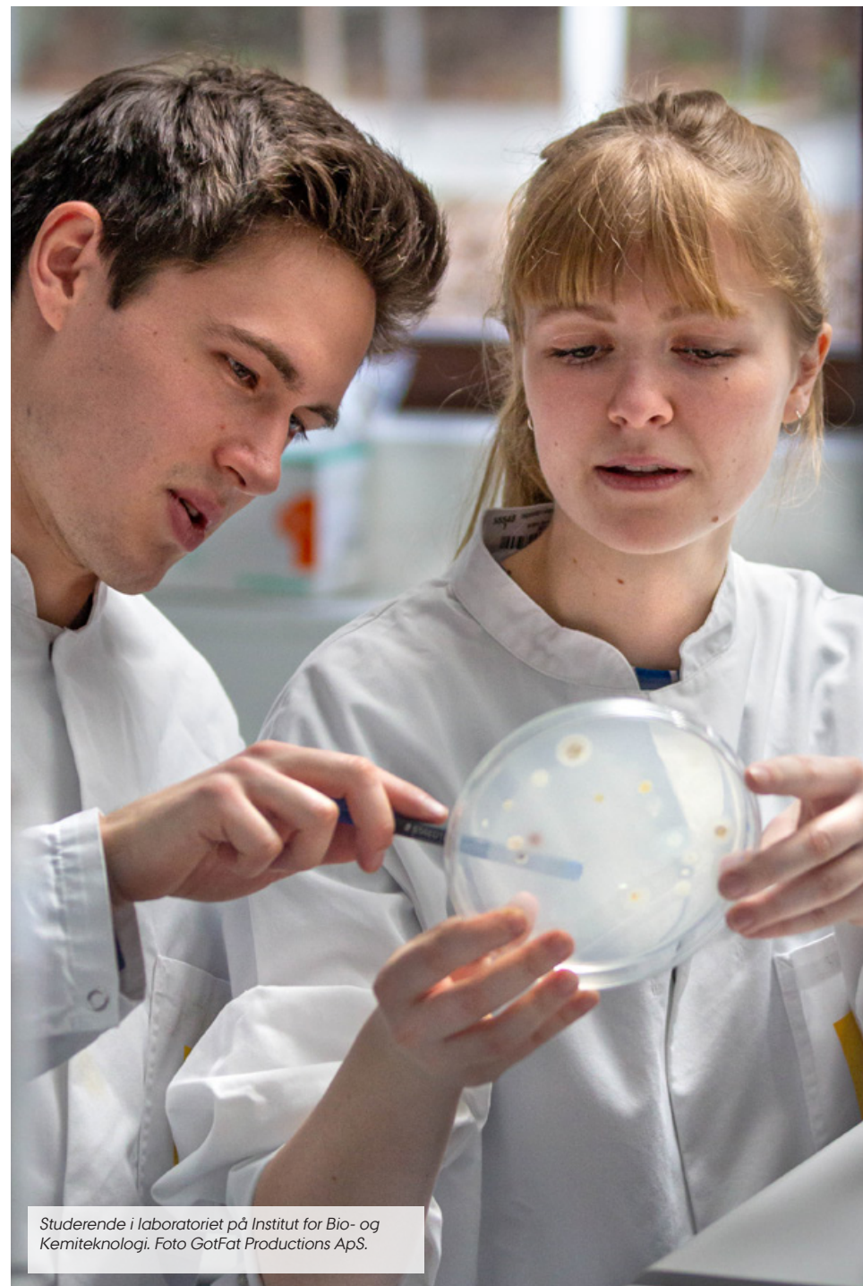
Studerende i laboratoriet på Institut for Bio- og Kemiteknologi.

På AU skal de studerende erfare, at uddannelserne er udviklet og tilrettelagt med inddragelse af relevante aftagerperspektiver. Aftagere skal derfor inddrages i det løbende arbejde med at udvikle kvalitet i AU's uddannelser.